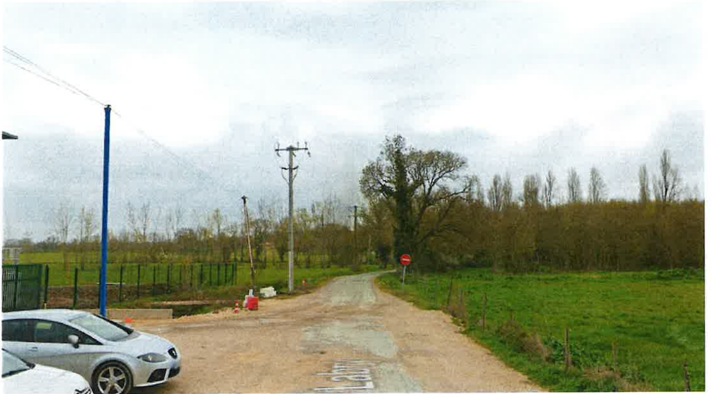
Sens Saint-André-de-Cubzac vers Cubzac-les-Ponts